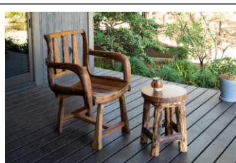
チーク古材チェア+スツールセット