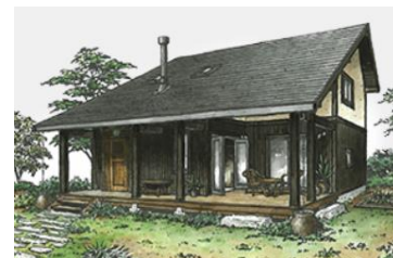
十露(そろ)／延床 130.83 m 2 (39.6 坪) 標準価格 33,088,000 円(税込)