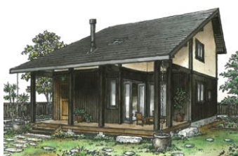
八風(やつかぜ)／延床 105.16 m 2 (31.8 坪) 標準価格 28,050,000 円(税込)