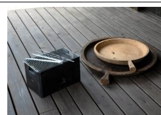
三河黒七輪+古材トレイセット

期間中、倭様「程々の家」をご契約いただいた方に上記の3種から一つ、お好きな道具をプレゼントします。