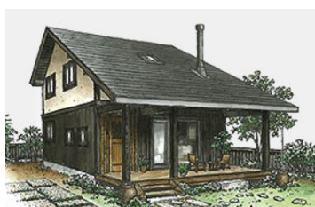
七色(なないろ)／延床 91.56 m 2 (27.7 坪) 標準価格 25,762,000 円(税込)

■ 倭様「程々の家」モデルラインナップ（3モデル） ※価格は地域により異なります。 暮らし方から、規模・プラン・価格を3つの企画モデルにてご用意しています。